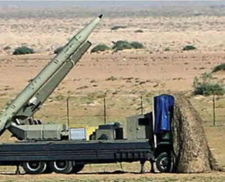
ขีปนาวุธรุ่น “ฟาเตห์ 110”