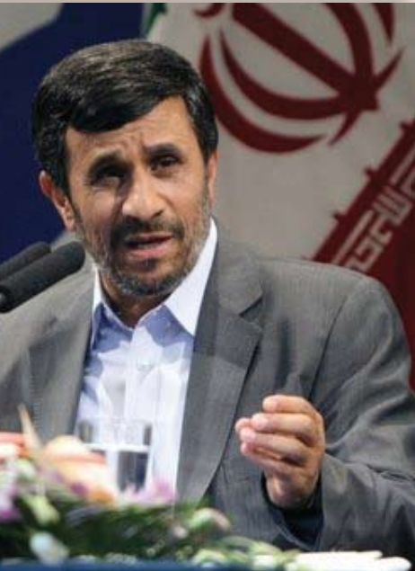
ประธานาธิบดี มะห์มูด อาห์มาดีเนจัด แห่งอิหร่าน

รัฐบาลอิหร่านมักแสดงแสนยานุภาพทางทหารอยู่เสมอและการเปิดตัวอาวุธครั้งล่าสุดก็สอดคล้องกับคำพูดที่ว่า อิหร่านพร้อมจะตอบโต้การโจมตีทุกรูปแบบ