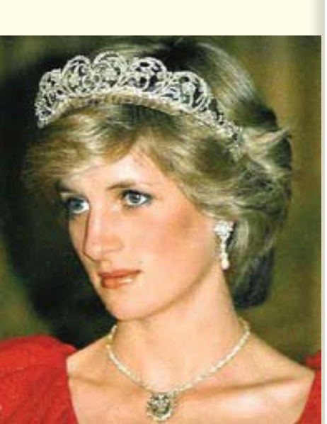
เจ้าหญิงไดอานา

“ตราใบที่ประเทศอังกฤษยังไม่ชอบคุณ และตอบแทนสิ่งดีๆ ที่เจ้าหญิงไดอานาทรงกระทำด้วยการสร้างอนุสาวรีย์ให้สมพระเกียรติ รูปปั้น “เหยื่อผู้บริสุทธิ์” สิ่งนี้ก็จะเป็นเครื่องเตือนใจให้ชาวโลกรับรู้ว่าคนที่ทนสองคนซึ่งรักกันต้องมาจบชีวิตลงเป็นความสูญเสียแก่ไหน” เขากล่าว