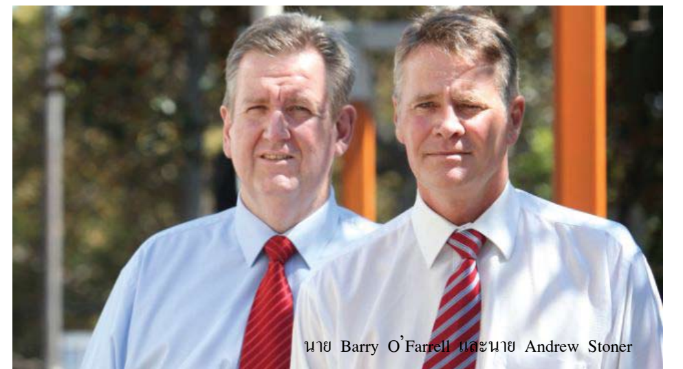
นาย Barry O'Farrell และนาย Andrew Stoner

30ม.ค.2012 นาย Barry O'Farrell นายกรัฐมนตรีรัฐน.ซ.ว. ได้ยกเลิกคำสั่งนโยบายใช้น้ำมันเอทานอล 10% พร้อมกับยกเลิกการห้ามใช้น้ำมันไร้สารตั้งแต่วันที่ 1 กรกฎาคมออกไปเรียบร้อยแล้ว